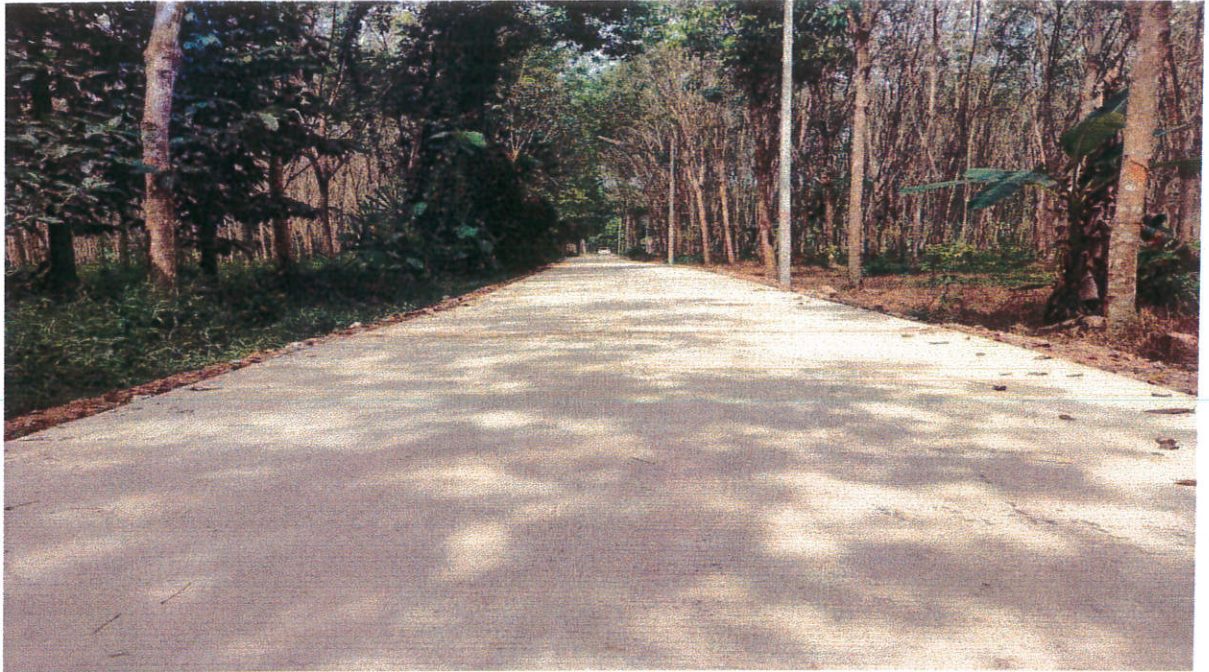
โครงการก่อสร้างถนนคอนกรีตเสริมเหล็กสายระหว่างคลอง - กุโบว์ หมู่ที่ ๘