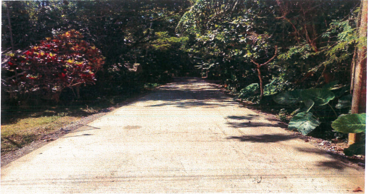
โครงการก่อสร้างถนนคอนกรีตเสริมเหล็กสายบ้านผู้ใหญ่สม หมู่ที่ ๓