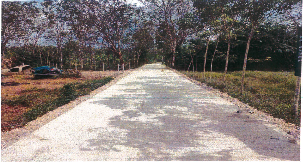
โครงการก่อสร้างถนนคอนกรีตเสริมเหล็กสายซอยต้นมะขาม