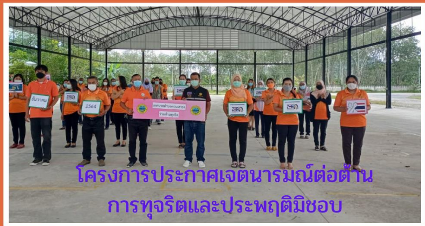
โครงการประกาศเจตนารมณ์ต่อต้าน การทุจริตและประพฤติมิชอบ